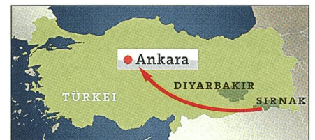
Die geplante C-130-Route für die Putsch-Flüge nach Ankara – elend gescheitert.