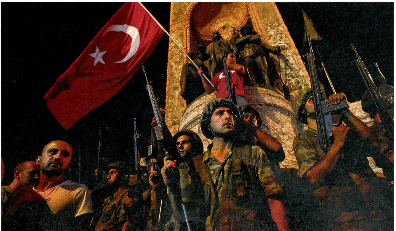
16. Juli 2016, 4.30 Uhr, am Atatürk-Denkmal in Istanbul: Regierungstreue Soldaten und Erdogan-Anhänger halten Wache.

Kurz darauf strömen seine Anhänger auf die Strassen, stellen sich vor Panzer, es kommt zu bewaffneten Auseinandersetzungen zwischen Putschisten auf der einen