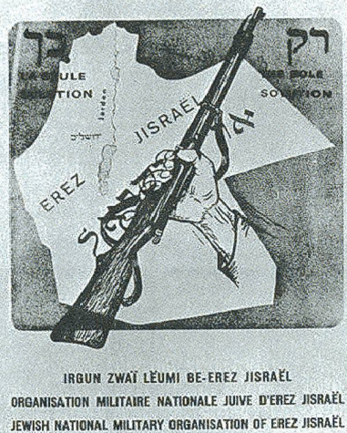
Plakat des Irgun: Israel umfasst das britische Mandatsgebiet mit Transjordanien.