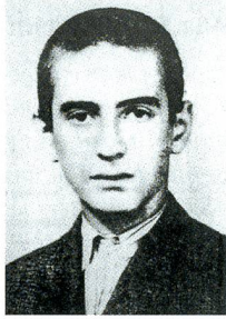
Elie Wiesel nach dem Zweiten Weltkrieg.

Elie Wiesel stammte aus dem ungarischen Städtchen Sighet. Er hatte Auschwitz