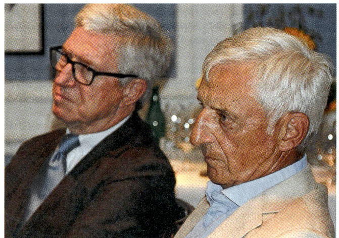
Intensive Anteilnahme und Reflexion.