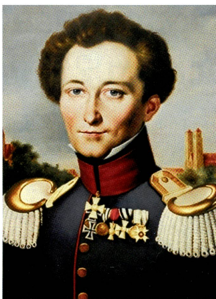
Der preussische Militärphilosoph Freiherr Carl von Clausewitz (1780–1831).

Mit seiner Zweck-Ziel-Mittel-Relation und dem Mass der Mittel zwingt er den Strategen, methodisch zu beurteilen, ob ein Krieg sinnvoll sei und welche Mittel zum Erreichen der vorgegebenen politischen