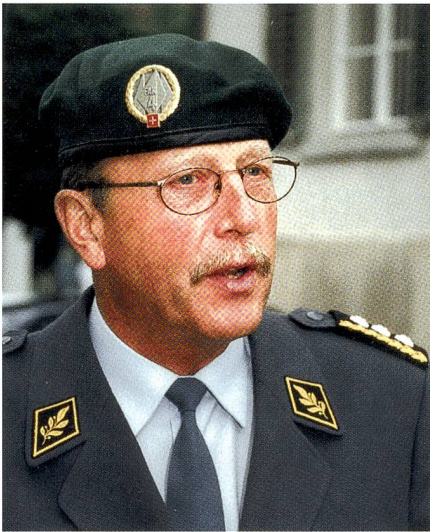
Auch als KKdt mit grünem Inf Beret.