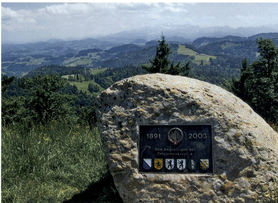
Auf dem Hörnli erinnert ein würdiger Gedenkstein an das Feldarmeekorps 4.

Jedes Jahr um Mitte Juni darf der «Hörnli»-Wirt eine stattliche Schar von Kameraden aus dem Stab FAK 4 begrüßen und bewirten. Die ganz Junggebliebenen wäh-