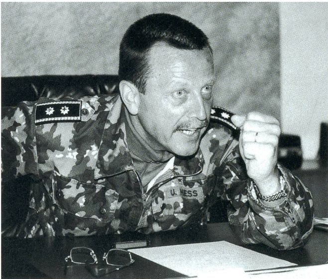
Als Kdt F Div 6: «Ich will...!»