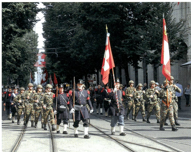
Der KUOV-Fahnenzug und die Compagnie 1861 beim Einmarsch.