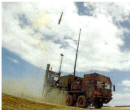
IRIS-T SL: Erfolgreicher Teststart.

Beim Projekt BODLUV 2020 handelt es sich um ein Abwehrsystem mit zwei unterschiedlichen Effektor-Reichweiten. Die mittlere Reichweite (MR) wirkt auf eine Distanz zwischen 20 und 50 km und die kurze Reichweite (KR, letzte Meile) auf eine Distanz von 3 km.