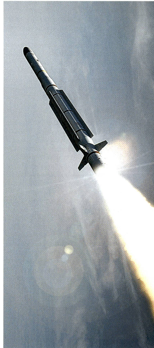
Die CAMM-ER des Unternehmens MBDA.

Kostenschätzungen in Rüstungsprojekten sind ein schwieriges Unterfangen. Die Beschaffung unterliegt dem Geschäftsgeheimnis. Genaue Angaben können erst mit dem Typenentscheid aufgrund der Of-