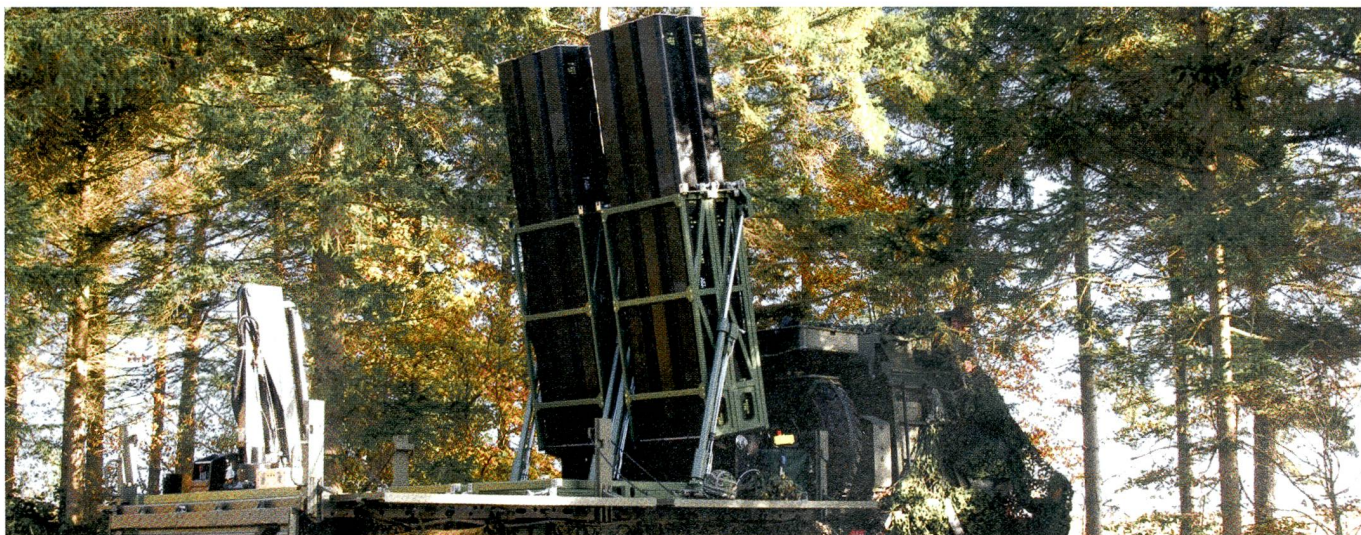
CAMM (Common Anti-Air Modular Missile) gehört zur Raketen-Familie, die MBDA zuerst für die britischen Streitkräfte entwickelte.