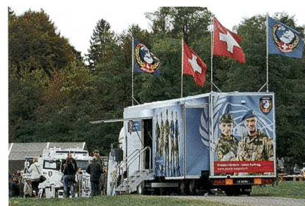
Auch SWISSINT ist sehr gut vertreten.