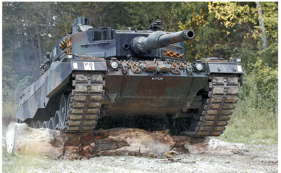
Kraftvoll überwindet der 56 Tonnen schwere Kampfpanzer Nummer 08 das Hindernis.