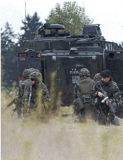
Panzergrenadiere im Schutz des Panzers.