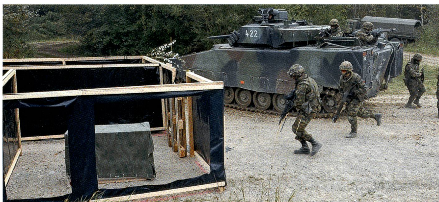
Panzergrenadier-Angriff im überbauten Gelände. Hinten der Schützenpanzer 2000.