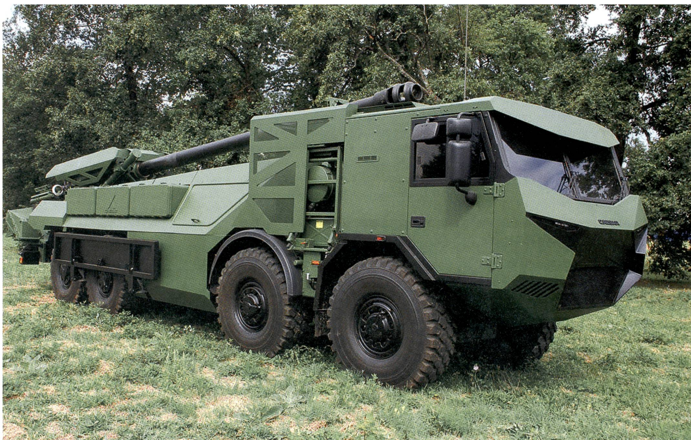
Der französische Camion Equipé d'un Système d'Artillerie CAESAR wurde von Nexter schon an mehrere Armeen verkauft.

Wenn man mit einem solchen Geschütz Camp Security oder Feuerunterstützung aus einem Stützpunkt heraus macht (analog Afghanistan), dann hat man ein optimales Kostenverhältnis – sofern Manpower günstig ist.» red.