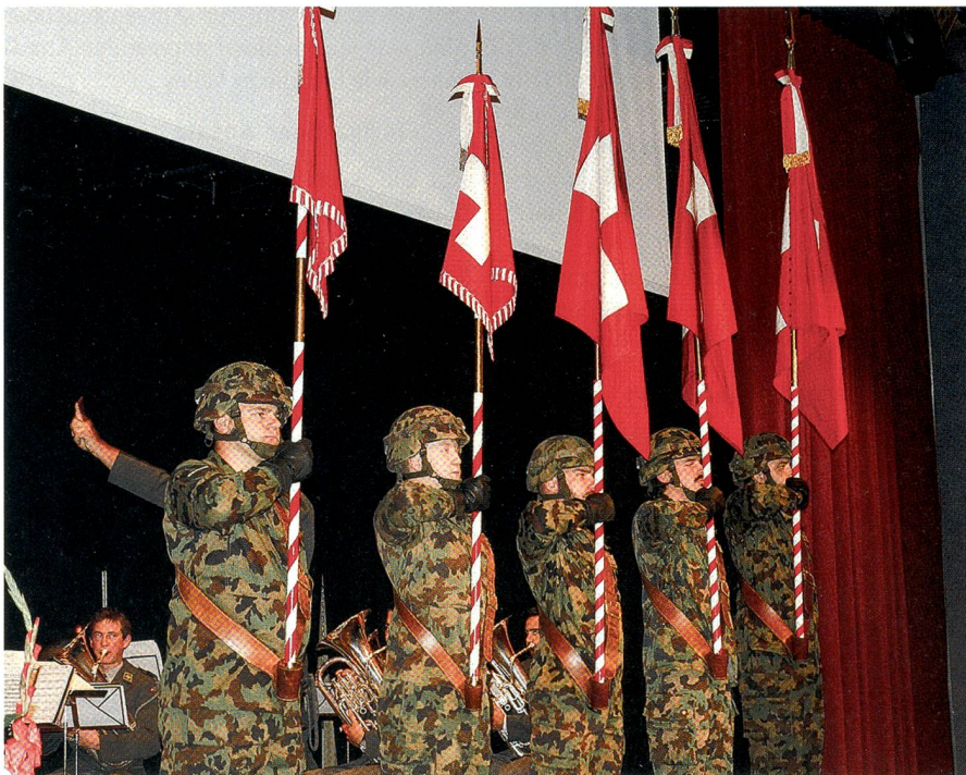
Die Suisse romande hat Sinn für Repräsentation: Die Feldzeichen der Ter Reg 1.

Luxemburg, erklärte die Sicherheitslage in und an den Grenzen von Europa.