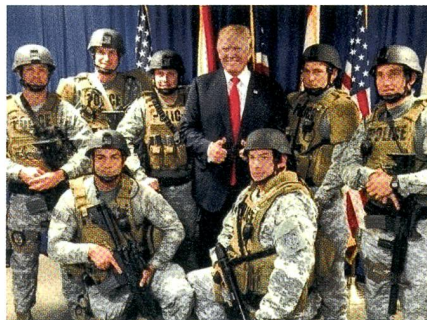
Donald Trump mit Polizeigrenadiern.