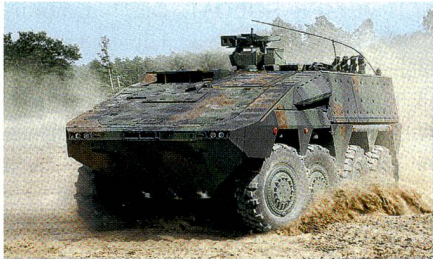
Test des GTK Boxer in Litauen.

Rheinmetall und Krauss-Maffei Wegmann werden im Zeitraum zwischen 2017 und 2021 den litauischen Streitkräften 88 geschützte Radschützenpanzer GTK Boxer im Wert von 390 Millionen Euro liefern. Litauen wird damit neben Deutschland und den Niederlanden der dritte Staat, der das