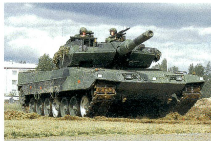
Neue Elektronik für den Stridsvagn 122.

Saab wurde von Krauss-Maffei Wegmann beauftragt, für die schwedischen Kampfpanzer Leopard 2 mit der Bezeichnung Stridsvagn 122 eine neue Fahrzeugelektronik mit Geräten und Verkabelung zu entwickeln und zu liefern. Mit dem Auftrag