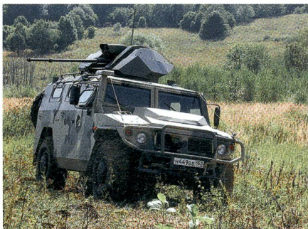
Test des GAZ Tigr mit 30-mm-Kanone.

Das ferngesteuerte Fahrzeug konnte in ersten Fahr- und Schiesstests überzeugende Ergebnisse erzielen. Der Tigr wird seit 2004 produziert und wird neben der russischen Marineinfanterie und dem russischen Heer