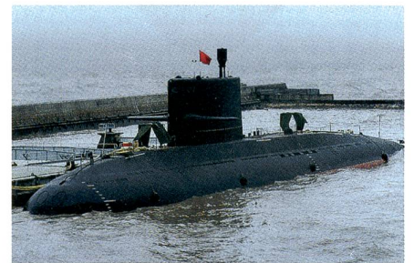
Chinesische U-Boote der YUAN-Klasse.

Nun wurde entschieden, drei U-Boote der YUAN-Klasse für ca. 1,3 Milliarden