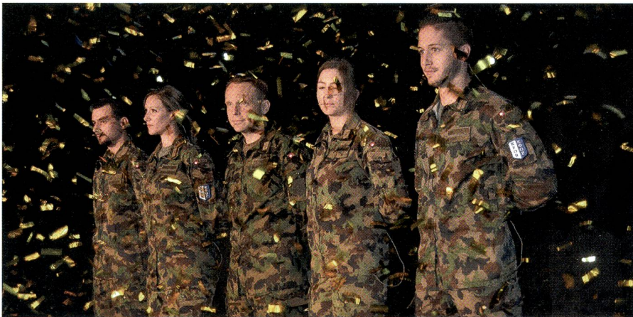
Goldregen in Stans: SWISSINT stellte schon 10 000 Peace Supporter – Seiten 14/15.