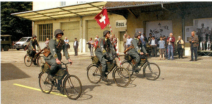
So kamen in der Geschichte die Radfahrer daher.