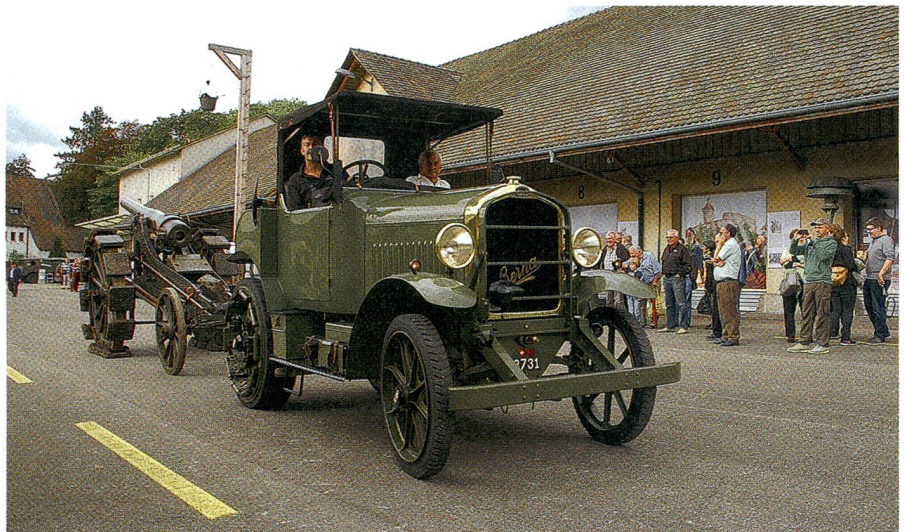
Berna Artillerietraktor mit Radgürtelkanone.

Mit 45 Exponaten zeigte das MiZ die Geschichte der Beschaffung und Verwendung von Motorfahrzeugen der Schweizer Armee und deren enge Verknüpfung mit der Geschichte der schweizerischen Motorfahrzeug- sowie der Schaffhauser Industrie.