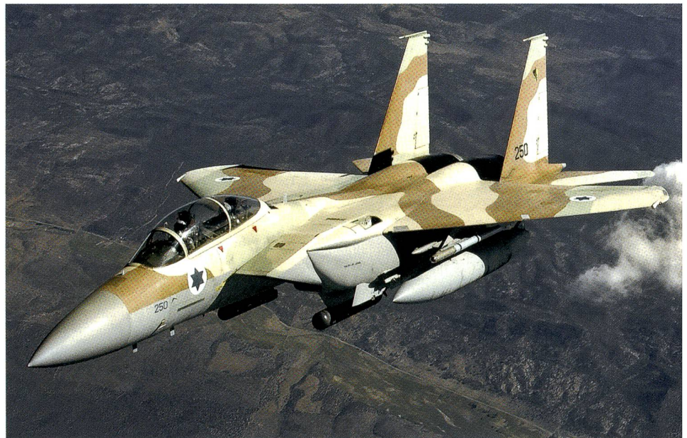
F-15 der israelischen Luftwaffe. 2016 erhält Israel den F-35.

Wohl hatten Präsident Putin und Premier Netanyahu noch im September Absprachen getroffen, die den Zusammenprall der russischen und der israelischen Luftwaffe verhindern. Dennoch war die Operation vom 11. November 2015 mit einem gewissen Risiko verbunden.