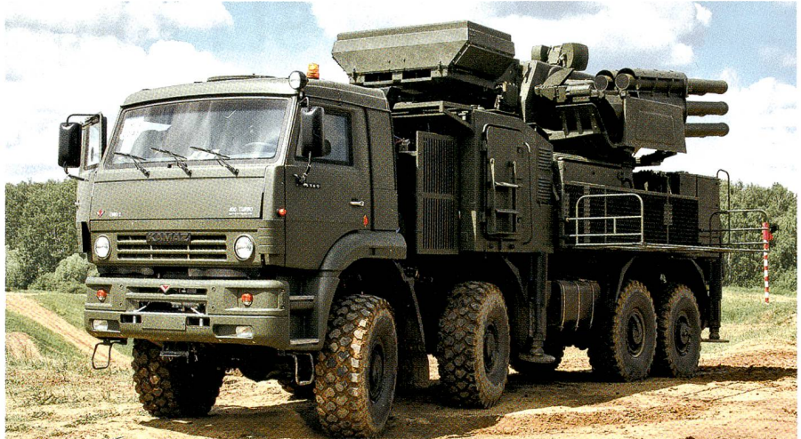
Das russische Flabsystem Pantsir-S1.