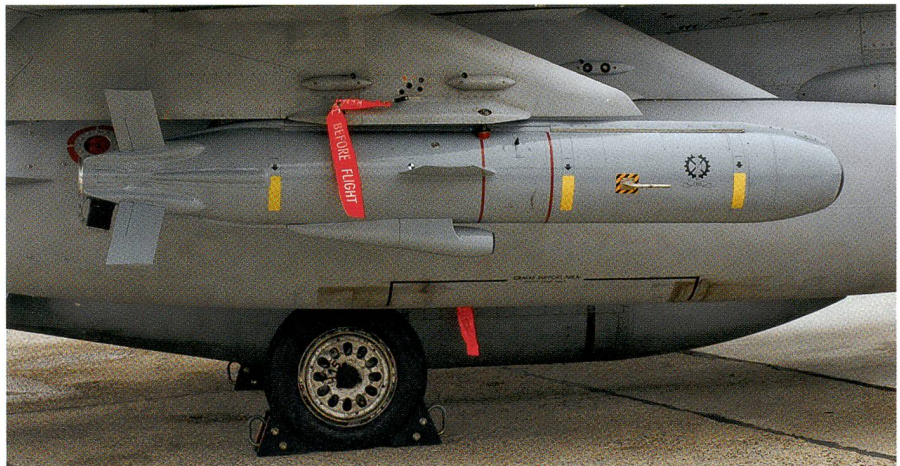
Der Marschflugkörper Delilah von Israel Military Industries.