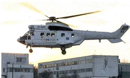
Super-Puma-Produktion in Rumänien.

Die getaktete Montagelinie soll jährlich bis zu 15 Helikopter herstellen. Die neue H215 vereint laut Hersteller «bewährte, kostengünstige Technologie mit einem neuen Geschäfts- und Industriekonzept», was zusammen mit den günstigen Lohnkosten den Preis senken soll, um gegen Muster wie die Mi-8/17 konkurrenzfähig zu sein. «Die H215 ist von strategischer Bedeutung für Airbus Helicopters. Mit ihr können wir unseren Kunden einen Helikopter anbieten, der optimal auf ihre An-