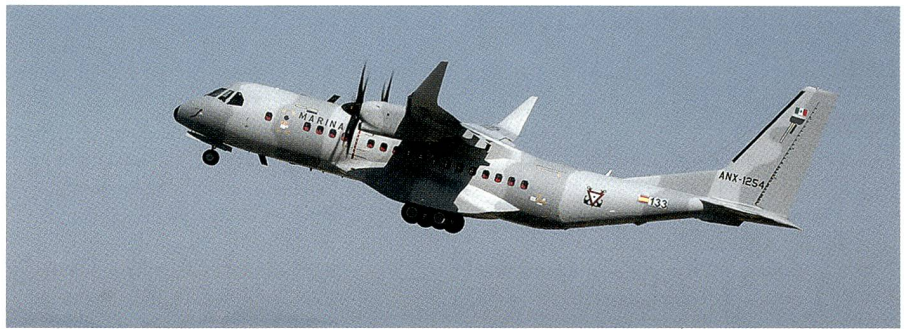
C295W der mexikanischen Marinestreitkräfte zeigt ihr Können.

Das C295W-Demonstrationsflugzeug mit Winglets gehört den mexikanischen Marinestreitkräften. Die Maschine befand sich vom 15. November bis zum 10. Dezember auf einer Demo-Tour in Lateinamerika, hier sollte der mittelschwere Transporter zeigen, was er auf hoch gelegenen Flugplätzen zu bieten hat. Neben dem internationalen Flugplatz El Alto in La Paz, der auf einer Höhe von mehr als 4000 Metern liegt, wurden auch Cochabamba und eine unbefestigte Piste in San Borja angefliegen. Ne-