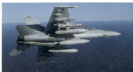
Super Hornet mit dem neuen Seezielflugkörper AGM-84N Harpoon Block II+.

Eine Super Hornet der US Navy hat einen modifizierten Seezielflugkörper AGM-84N Harpoon aus dem Block II+ erfolgreich abgefeuert. Der modernste Harpoon Seezielflugkörper wurde zuerst halbaktiv über den