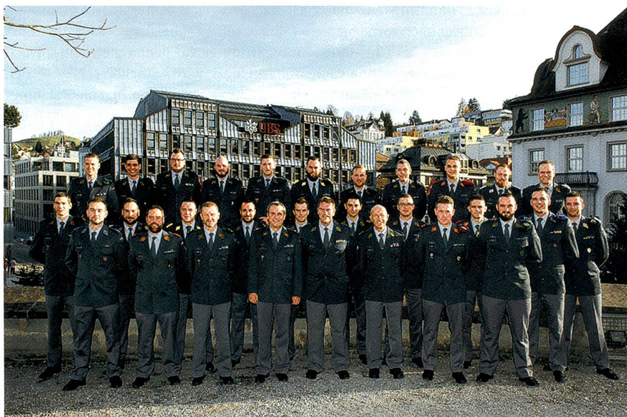
Herisau: Das obligate Gruppenbild mit den frisch brevetierten Berufsunteroffizieren.

Was für ein wahrlich prächtiges Bild, als die angehenden Berufsunteroffiziere in