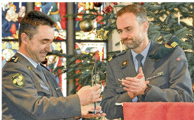
Der Kommandant des Lehrverbandes mit Oberst i Gst Frey.

Landesstatthalter (im Aargau Vizepräsidentin des Regierungsrates) Susanne Hochuli würdigt in einer kurzen, sympa-