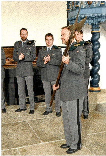
Abtretender Kommandant mit Hellebarde.