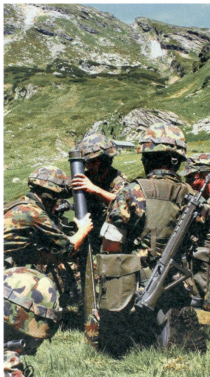
Die Geschützstellung wird aufgebaut.

Der Befehl «RITORNO» bedeutet für die Kader und Soldaten «Ende Feuer» und Rückkehr mit dem Material. Die Stellungen bleiben aber bestehen, damit der nächste Mw Z nahtlos dort weitermachen kann, wo der letzte Zug aufgehört hat. +