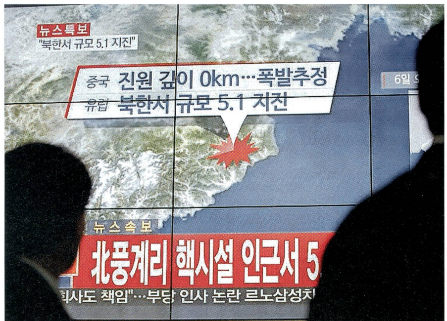
In Südkorea erfahren die Menschen, dass Nordkorea eine Nuklearwaffe zündete.