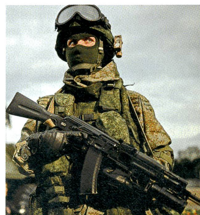
Spzinas: Seit 1950 an allen Fronten

Aktiv im Einsatz sind Spzinas-Verbände in der Ostukraine, wo sie die pro-russischen Aufständischen an den Brennpunkten des Donbasskrieges unterstützen.