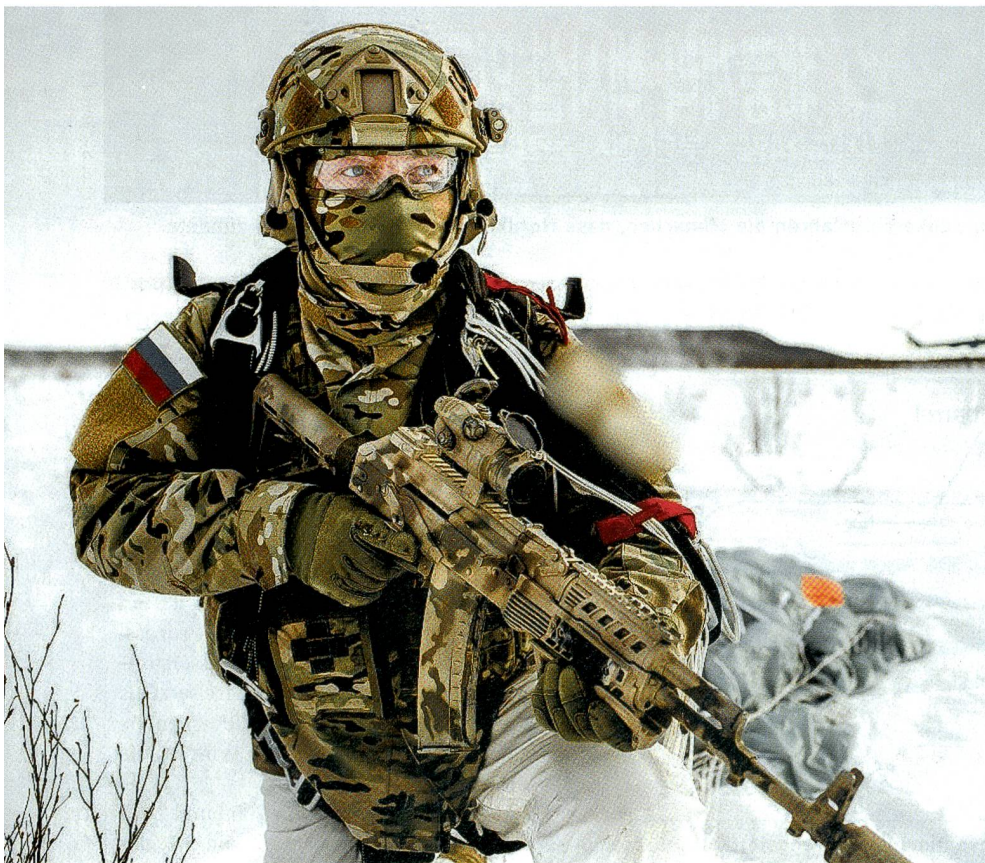
Unbekannter Speznas-Soldat ohne Gesicht. Auf dem Ärmel die Farben Russlands.

Auf dem Luftstützpunkt Hmeimim bei Latakia, von dem aus die russischen Su-24,