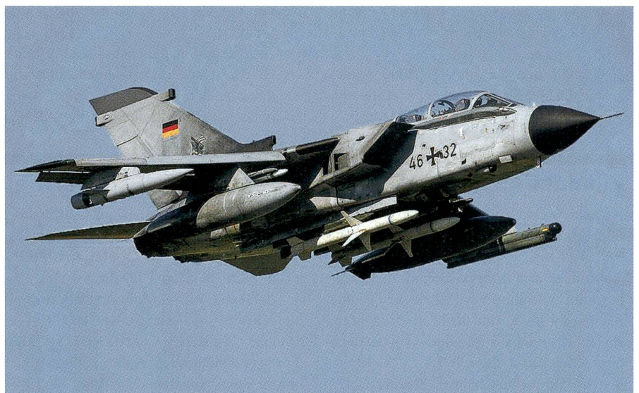
Das ist ein Tornado ohne Aufklärungssystem.