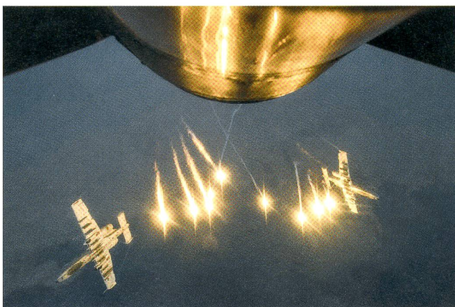
Zwei amerikanische A-10 Warthog stossen Flares aus, nachdem sie von einem KC-135-Stratotanker betankt wurden.