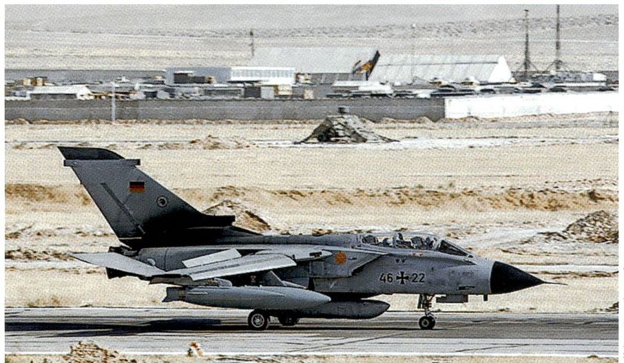
Recce-Tornado der Bundeswehr. Unter dem Rumpf das digitale Aufklärungssystem.

Der IDS-Tornado bildet die Basis für den Recce-Tornado. Dieser Typ führt seit 2009 in einem Behälter unter dem Rumpf das digitale Aufklärungssystem Recce Lite mit sich. Recce Lite erstellt bei Tag und