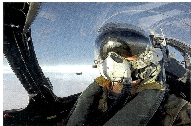
Französischer Kampfpilot über dem Fruchtbaren Halbmond.