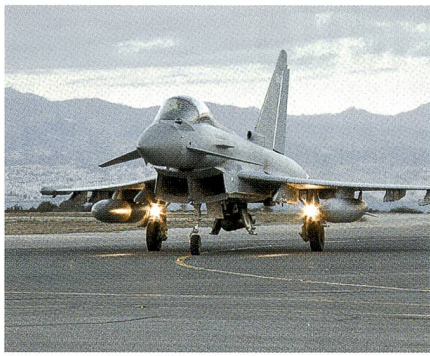
Zypern: Britischer Typhoon kehrt zurück.