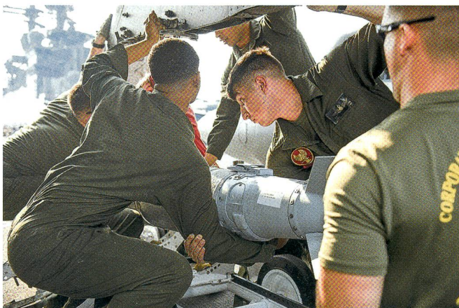
Amerikaner laden AV-88 Harrier auf der USS Kearsarge.