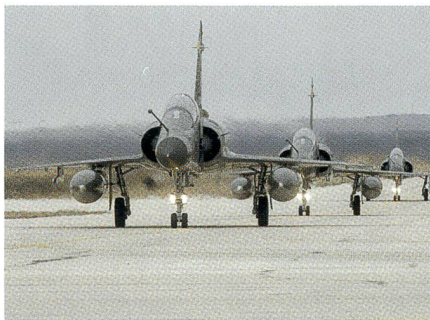
Drei Mirage 2000-N erreichen Jordanien.