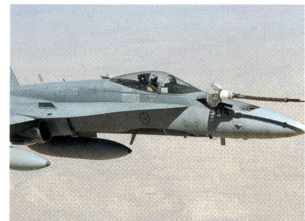
F/A-18, Kanada, von RAF Voyager betankt.

Bilder vom Syrienkrieg Der britische Blog airwars bringt jeden Tag präzise Einsatzrapporte zum alliierten Luftkrieg gegen den ISIS. Der Blog zitiert wörtlich die täglichen Bulletins der beteiligten Luftwaffen (ausser den russischen). Gleichzeitig wartet airwars mit gestochenen scharfen Bildern auf, welche die beteiligten Luftwaffen dem Blog zur Verfügung stellen. Hier eine Auswahl.