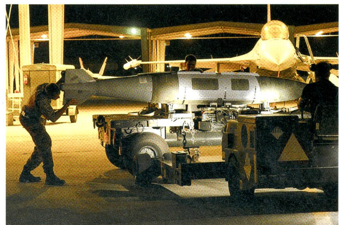
Zum letzten Mal montieren Dänen eine 2000-Pfund-Bombe an eine F-16. Im Oktober 2015 zog Dänemark die Luftwaffe zurück.