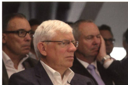
150 Gäste kamen in den Pfalz Keller.