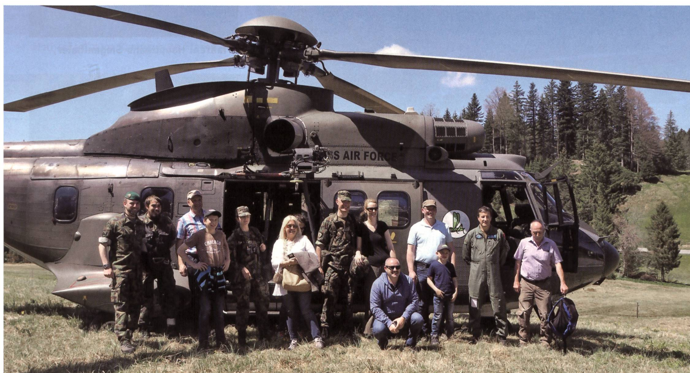
Besucherinnen und Besucher am Erlebnistag des Gebirgsschützenbataillons 6.

Zum Abschluss des erlebnisreichen Besuchstags wurden den Gästen eigens kreierte Schokolade sowie Biberli mit dem Emblem des Geb S Bat 6 überreicht. +