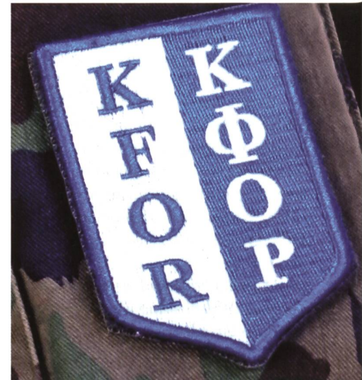
Bagde KFOR. Rechts kyrillisch.

Denkmäler und Friedhöfe gefallener UCK-Soldaten begegnen uns im Süden auf Schritt und Tritt, und im Norden we-