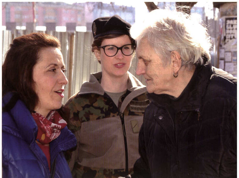
Gespräch mit einer pensionierten Juristin in Mitrovica – links die Dolmetscherin.