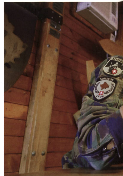
Obwm Brigitte Stoll, Krankenschwester im Spital