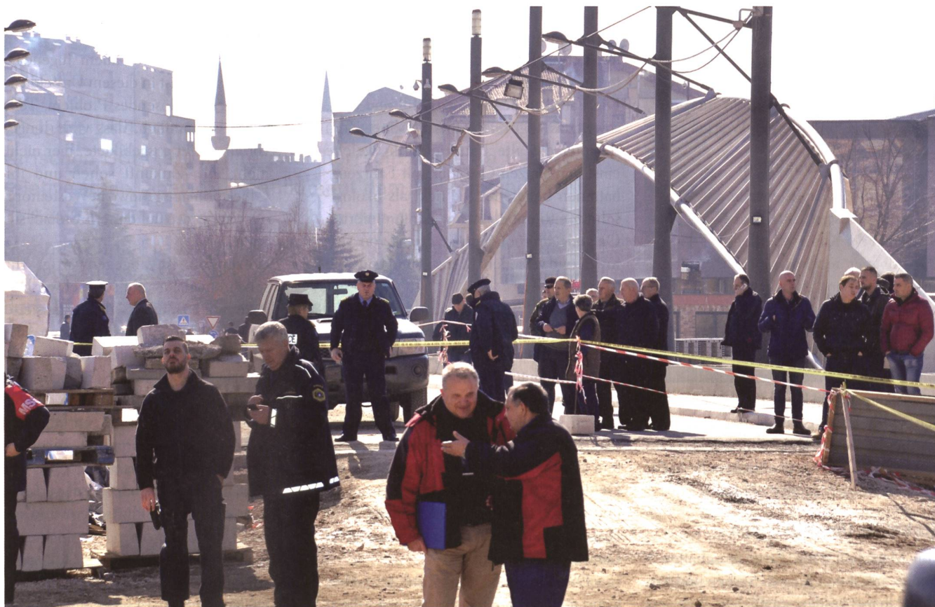
Austerlitz-Brücke trennt Serben und Albaner in Mitrovica.

rell und auch bei der KSF (Kosovo Security Force), ein ganz grosses Thema. Nur wer einen «guten Onkel» irgendwo in der Hierarchie kennt, soll hier eine Stellenchance haben.