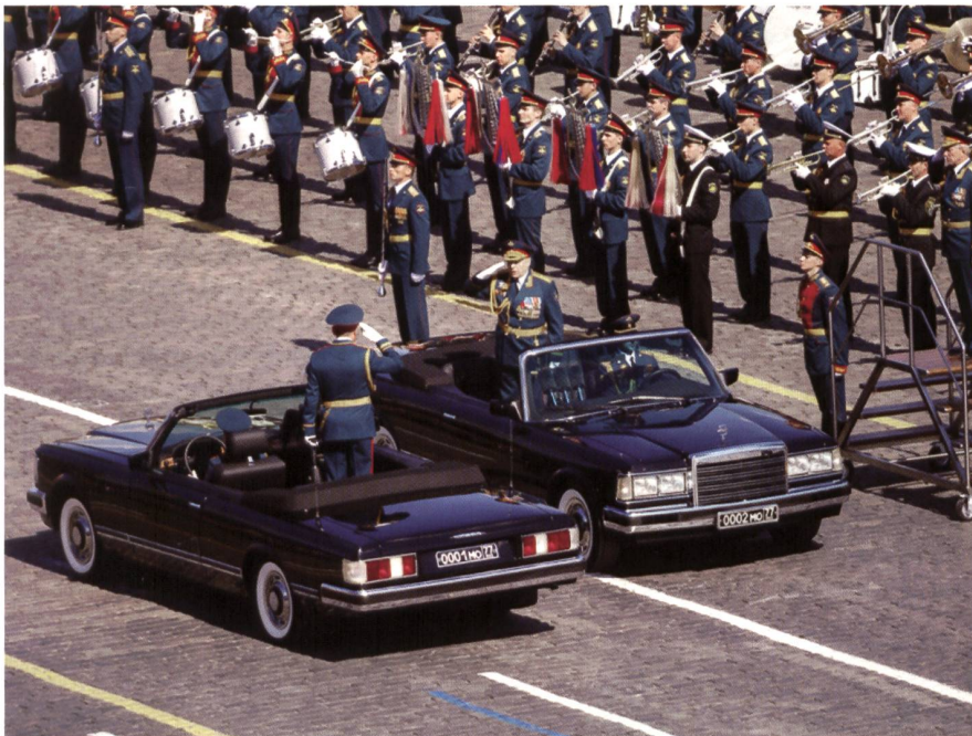
Generaloberst Salukow, Befehlshaber des Heeres (Wagen 0002), meldet dem Verteidigungsminister Shoigu (Wagen 0001) die Paradedruppe der Garnison Moskau.

Am 9. Mai 2017 rollten russische Arktis-Waffen über den Roten Platz. Mit Systemen, die Temperaturen von 40 Grad unter Null aushalten, hob der Generalstab die Bedeutung hervor, die er dem Wettlauf um den hohen Norden beimisst. Fast schon traditionell präsentierten die Panzer- und Artillerietruppen die Waffen, die an der Parade 2015 Aufsehen erregt hatten: den Kampfpanzer T-14, den Schützenpanzer Kurganets-25 und die 152-mm-Haubitze Koalizija. Raketenverbände beschlossen das Défilé: so Iskander, eingesetzt in Syrien, und RS-24-Yars.