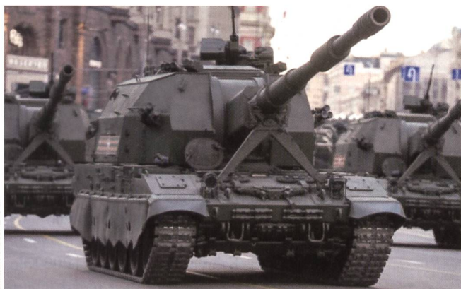
Das neue Geschütz Koalitzija-SW trifft auf 70 km genau.