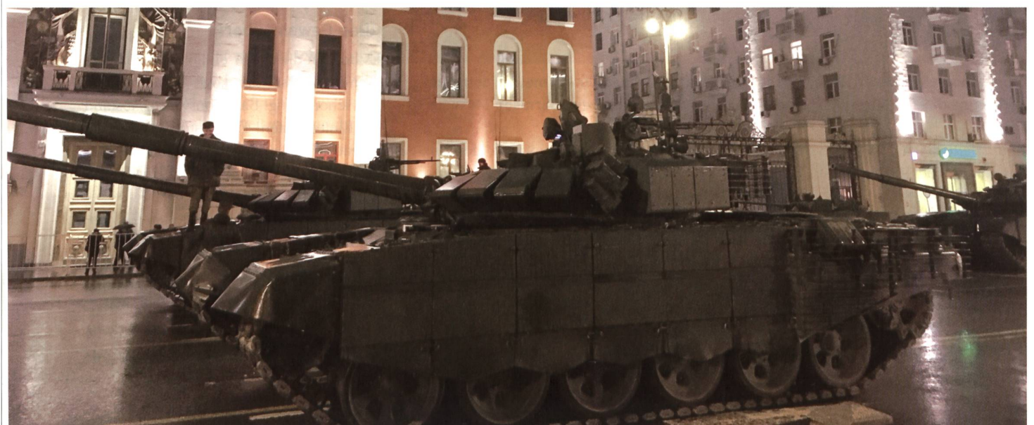
Zwei Kampfpanzer warten, bis sie mit ihrem Block, den Panzern der Garnison Moskau, zum Roten Platz abgerufen werden.

Die Einwohner von Moskau kennen das und machen seit dem Untergang der Sowjetunion ungeniert Fotos.