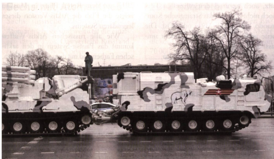
Die Arktis-Version des legendären Flab-Panzers Pantsir-S1 (NATO-Code SA-22 Greyhound). Der Pantsir der Waffenschmiede Ulyanoswk verbindet das Boden-Luft-Raketensystem 95Ya6 mit zwei 30-mm-Flab-Kanonen 2A38M von KBP Tula. Auch dieses Waffensystem kann bei 40 Grad unter Null eingesetzt werden.