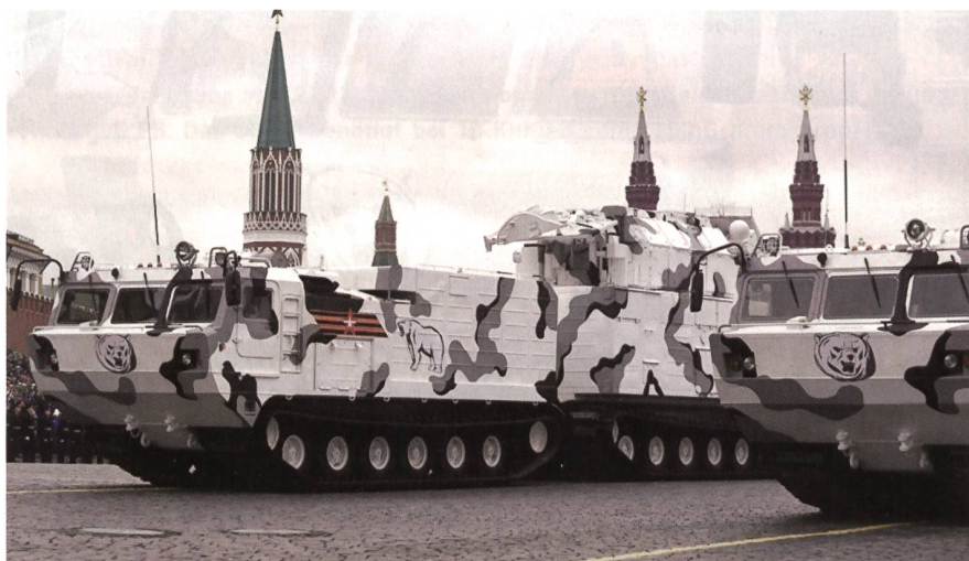
Der Arktis-Transporter Chetra TM-140A führt zusätzlich zur Besatzung acht Soldaten oder bis zu 1000 kg Fracht mit sich. Das Fahrzeug wiegt 11 200 kg, erreicht 45 km/h und hat eine Reichweite von 550 km. Es wird von der 250-PS-Gasturbine YaMZ-236-B2 angetrieben und hält Temperaturen bis zu 40 Grad unter Null aus.