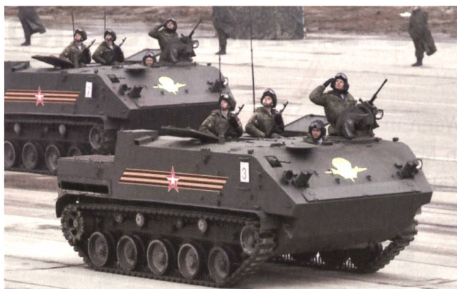
Der offensive Luftlande-Schützenpanzer BTR-MDM-4.

Militärschule in Moskau, deren Bestand der Parade kommentator mit 15 000 angab. Unter den Jugendformationen ragte die «Junge Armee» heraus, ein Lieblingskind Shoigus, mit einem Bestand von 70 000 Jugendlichen, geführt vom Viererbob-Olympiasieger Dmitrij Trunenkov.