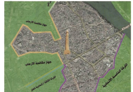
Am 21. Juni 2017, 12 Uhr, stehen die Iraker noch 50 Meter vor dem Minarett.

Bei Redaktionsschluss ist West-Mosul nicht ganz gefallen. Das Kalifat kämpft bis zum letzten Blutstropfen. Aber im Irak ist sein Schicksal besiegelt. In der Nuri-