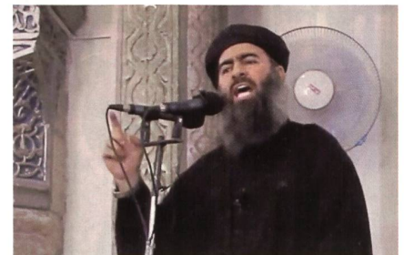
Am 4. Juli 2014 ruft ABB, Abu Bakr al-Baghdadi, in Mosul das Kalifat aus.

Moschee von Mosul rief am 4. Juli 2014 der damals 43-jährige Abu Bakr al-Baghdadi (ABB) das Kalifat aus. Er flüchtete dann ins syrische Rakkah, das Anti-ISIS-Truppen jetzt Schritt um Schritt einschliessen. Der territoriale Endkampf gegen das Kalifat wird primär Syrien heimsuchen.