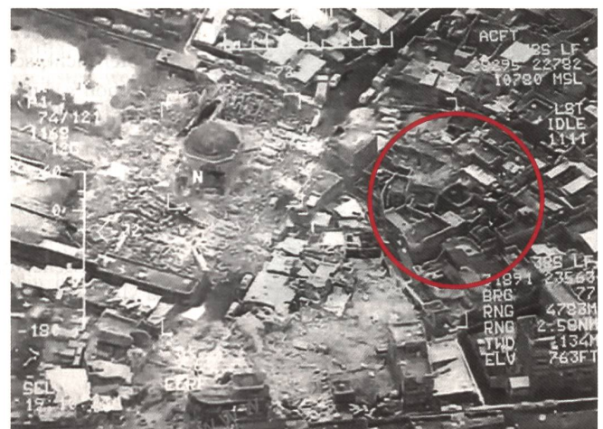
Unschärfes Satellitenbild. Im Kreis die Ruine des Minarett.