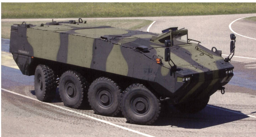
Der Piranha-5 ist bereit.

Vom Mowag-Testgelände bei Bürglen TG berichtet unser Korrespondent Wm Peter Gunz