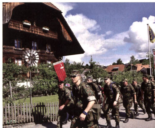
Die Wehrsportgruppe Schwyz.