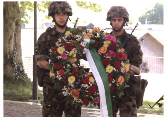
Blumen für den steinernen Soldaten.