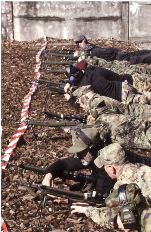
Das internationale Schiessen fand auf hohem Niveau statt.