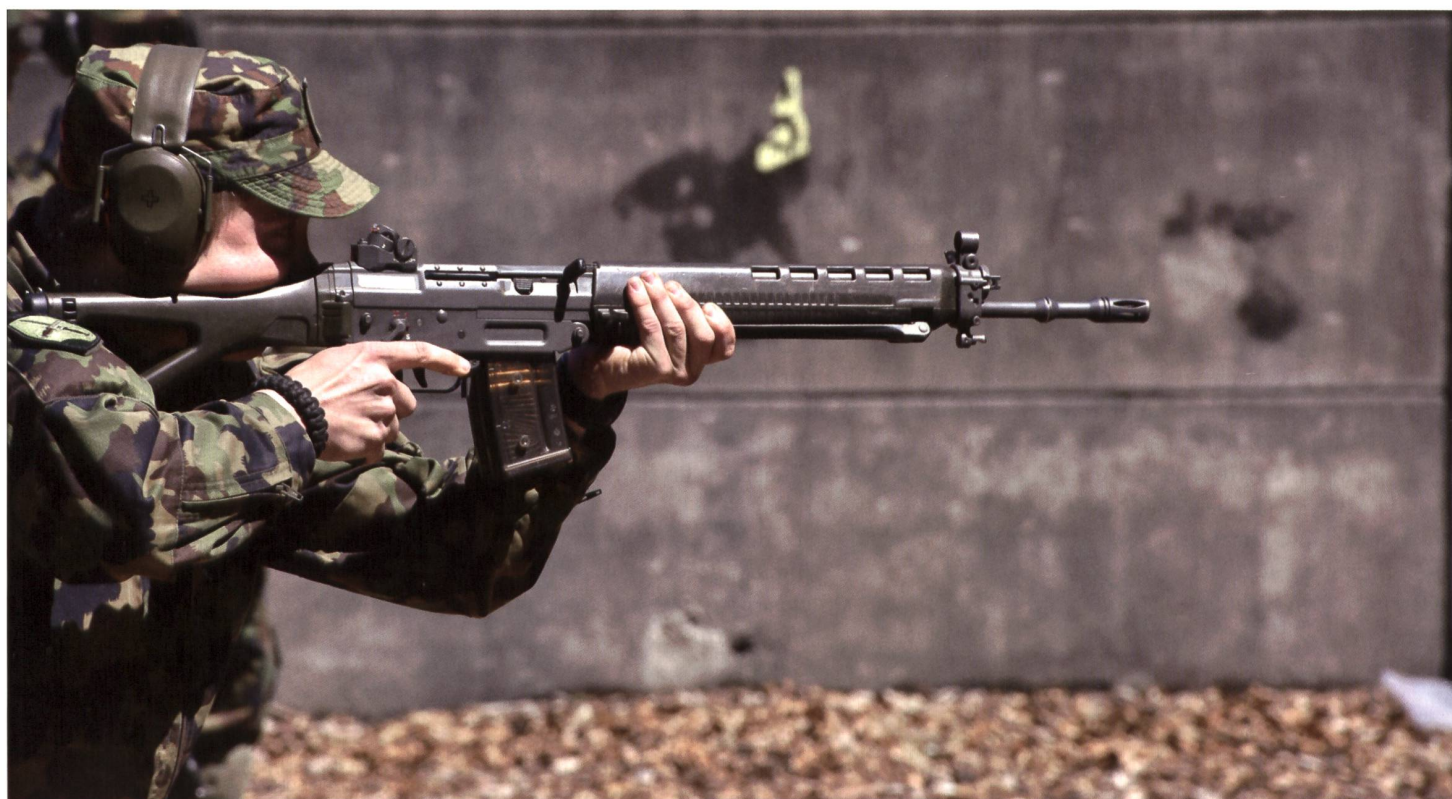
Der Posten Basic Rifle, hier war gute Einzelarbeit das A und O.

Von den Teilnehmern gab es viel positives Echo für die fünfte Auflage des militäri-