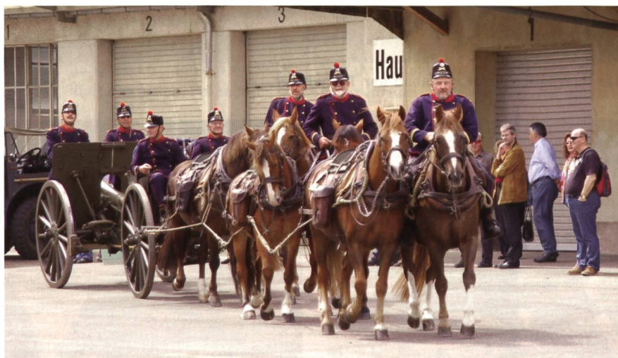
Das waren noch Zeiten: Sechsspännige pferdegezogene Kanone, Kaliber 7,5 cm.

Besucher, die mit dem Auto anreisen, folgen den Hinweisschildern «Museum im Zeughaus», die ab den Ausfahrten Schaffhausen Nord bzw. Süd den Weg weisen.