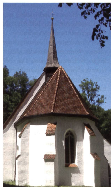
Kraftort der Eidgenossenschaft.

Die historische Einführung gibt Nationalrat Peter Keller (Nidwalden). Die beiden Festansprachen halten Vitus Huonder, der Bischof von Chur, und alt Bundesrat Christoph Blocher. Szenische historische Darstellungen zeigen das Leben und das Wirken von Bruder Klaus.