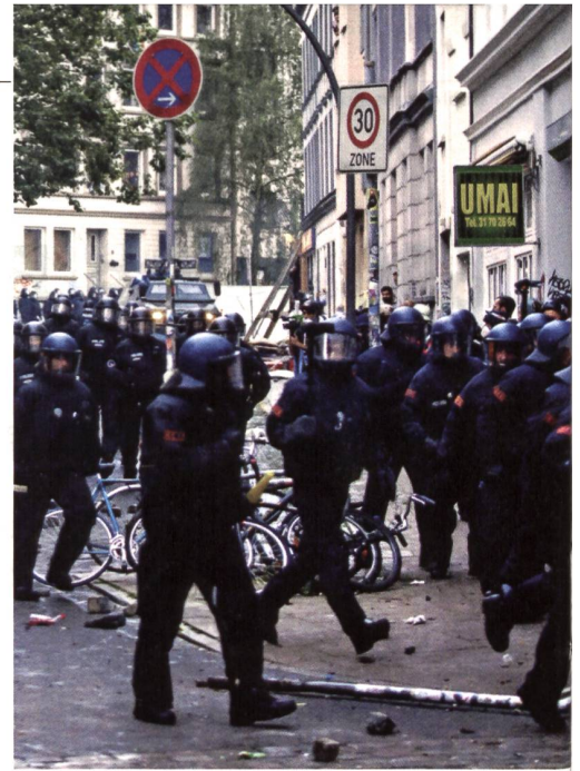
Bereitschaftspolizei im Anmarsch.

Um 8.12 Uhr erlässt die Einsatzzentrale landesweit einen dramatischen Appell. Sie sendet ein Fernschreiben an den Bund und an alle Bundesländer: «Bitte schickt alles, was Ihr habt».