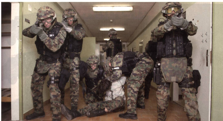
Kameradenhilfe im Militärpolizeibataillon 1. Lesen Sie die Seiten 18–21.