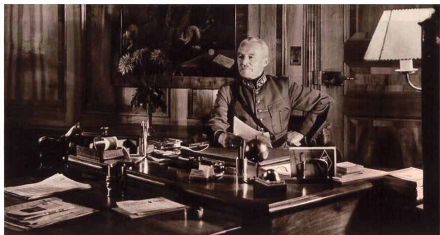
General Henri Guisan in Jegenstorf.