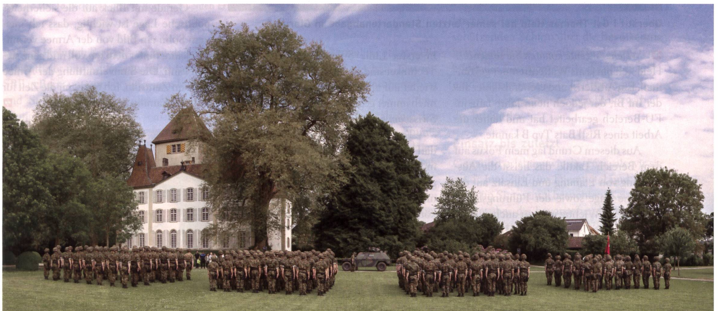
Feierliche Zeremonie vor dem Schloss Jegenstorf.