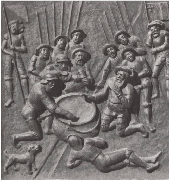
Zwinglitüre: Kappeler Milchsuppe, Juni 1529.