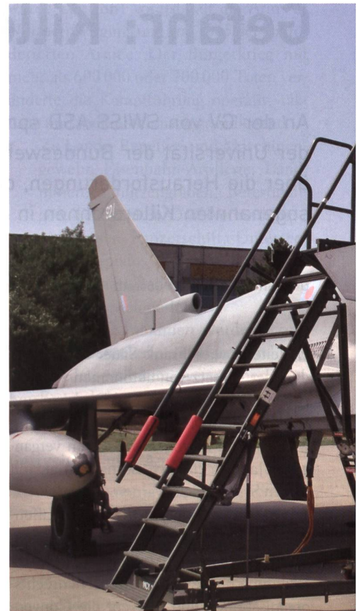
Die vier nach Rumänien gesandten Eurofighter

Der Begleitoffizier der RAF machte gleich zu Beginn klar, dass es angesichts