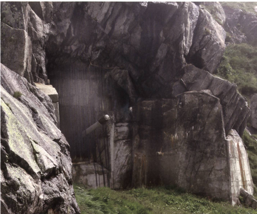
Eine Kanone von aussen.