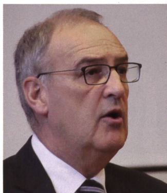
Bundesrat Parmelin, Chef VBS.