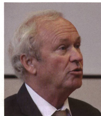
Regierungsrat Winiker, Luzern.