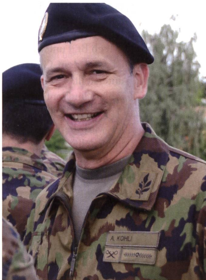
Br Kohli, Kdt Inf Br 5, bald Mech Br 4.