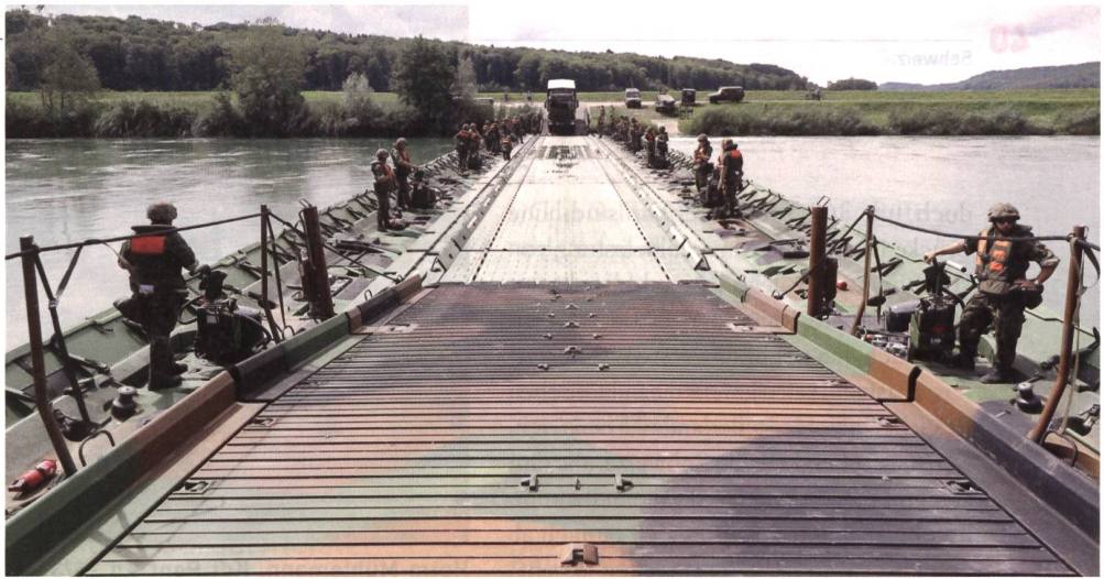
Nach erstaunlich kurzer Zeit steht die Brücke – heisst es: «PASSAGGIO».

Die einzelnen Brückenmodule, welche ab riesigen Sattelschlepper-Lastwagen nach und nach in den Hagneckkanal gleiten und in gezielten Manövern zur Brücke zusammengekoppelt werden, sind mit zwei 90 PS Aussenbordmotoren ausgerüstet, welche keinen Rückwärtsgang haben, je-