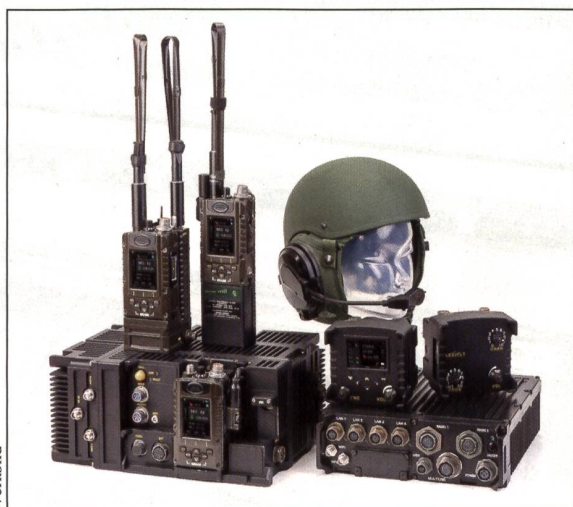
Das Elbit-System mit Boxen links und rechts. Sie sind fest im Fahrzeug eingebaut. Das linke Funkgerät mit Antennen dient dem Chef und das rechte trägt der Soldat. Die Geräte auf Box rechts dienen dem Fahrzeugführer und Beifahrer.