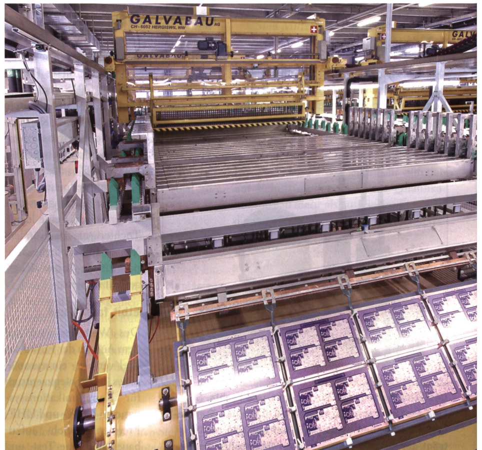
Für die Herstellung der Leiterplatten wird unter anderem auch eine Maschine aus Schweiz

Auf dem Gebiet der Systeme für die Hochfrequenz übernimmt das Werk Teisnach die Konzeption und die Herstellung