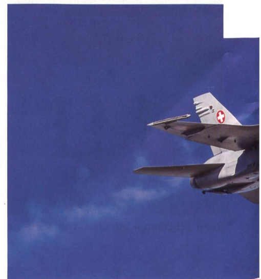
F/A-18. STBY 121.50 (mhz) = Funkfrequenz für