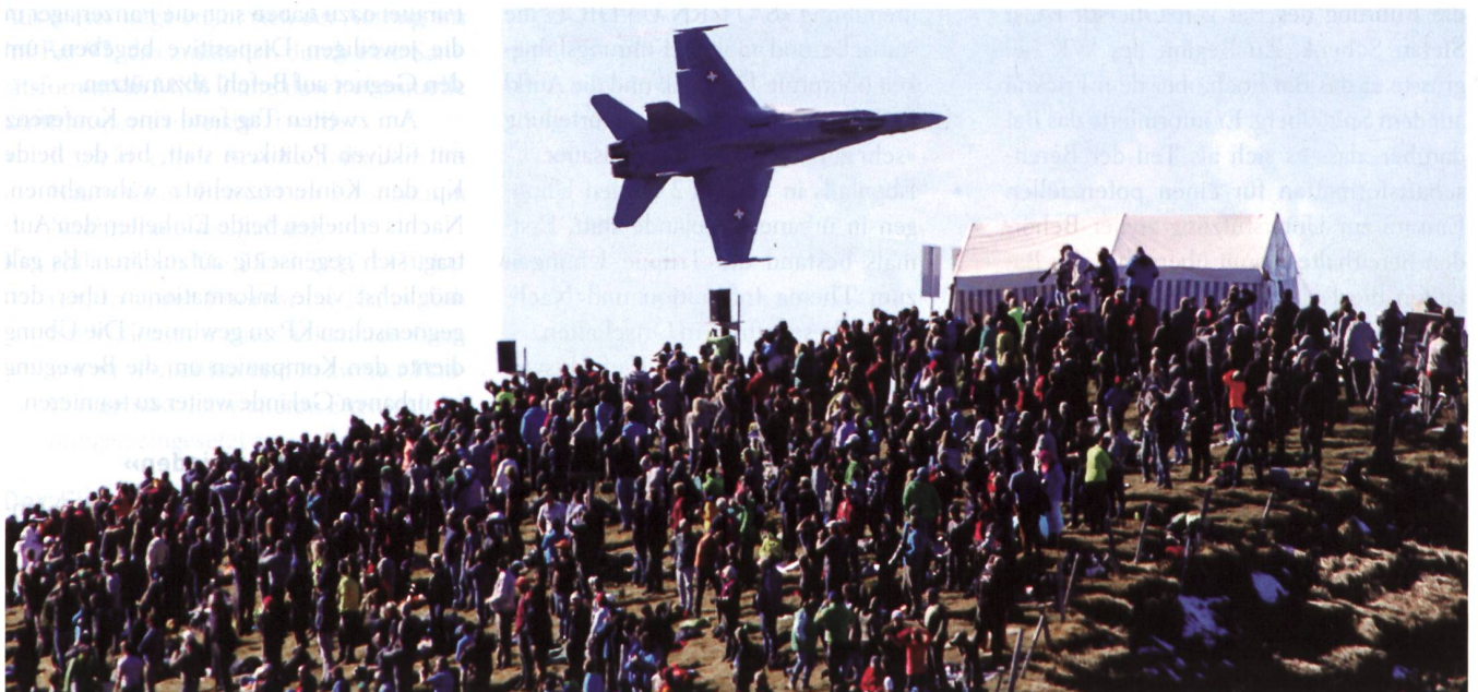
Ein F/A-18 zieht majestätisch über das Publikum hinweg – gemäss Fotograf Knuchel in einer Distanz von 150–200 Metern.