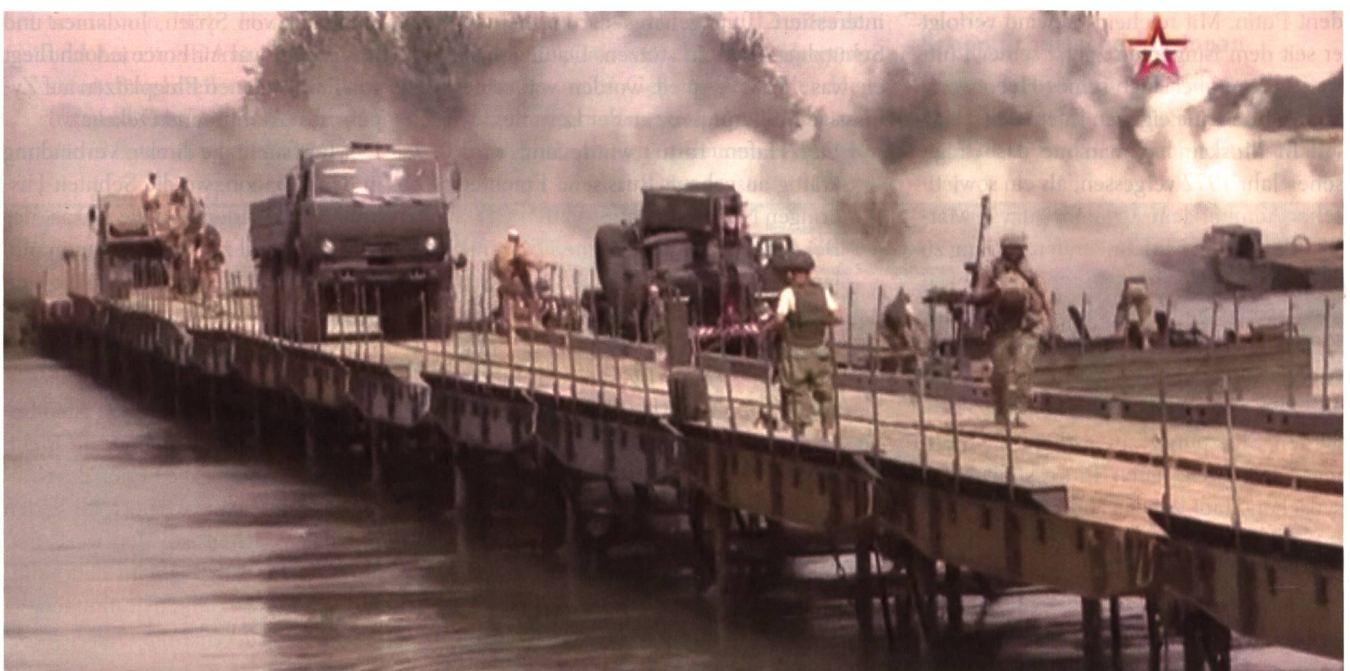
Unter andauerndem Minenwerfer-Beschuss überquert ein erster Kamaz-Lastwagen die 210 Meter lange Euphrat-Brücke.

Überdies können mehrere PMM-2M-Elemente zu einer Einheit verbunden werden, um so Material mit einem Gewicht von 127,5 Tonnen zu transportieren. Der