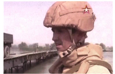
Oberst Wladimir Burowtsew, in russischer Nahostuniform, ohne Grad-, Hoheits- und Truppengattungsabzeichen.

Vom Stützpunkt der Luftwaffe brachten Tieflader das Material in einem pausenlosen Pistenmarsch über mehr als 1000