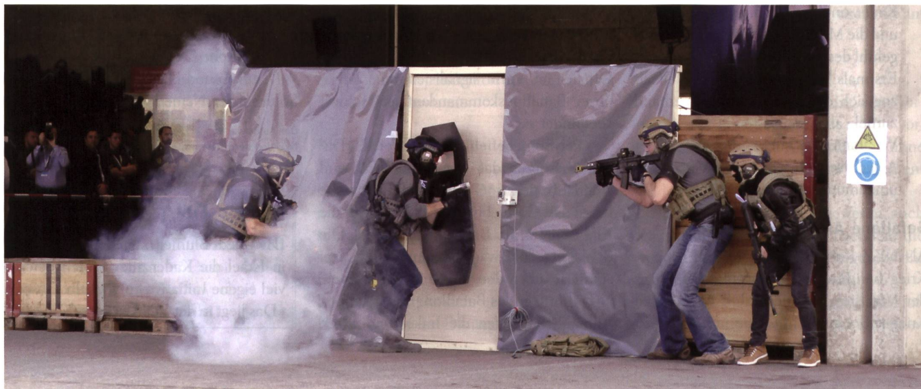
In Thun zeigte Ruag eine kombinierte Übung der Armee mit Polizei, Sanität und Feuerwehr zum Thema Geiselnahme.