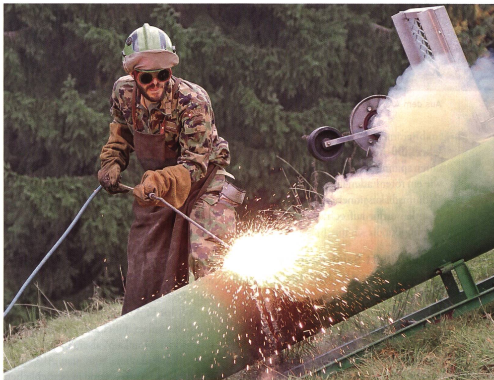
Ein Rettungssoldat mit Sauerstofflanze zerlegt einen Mast.