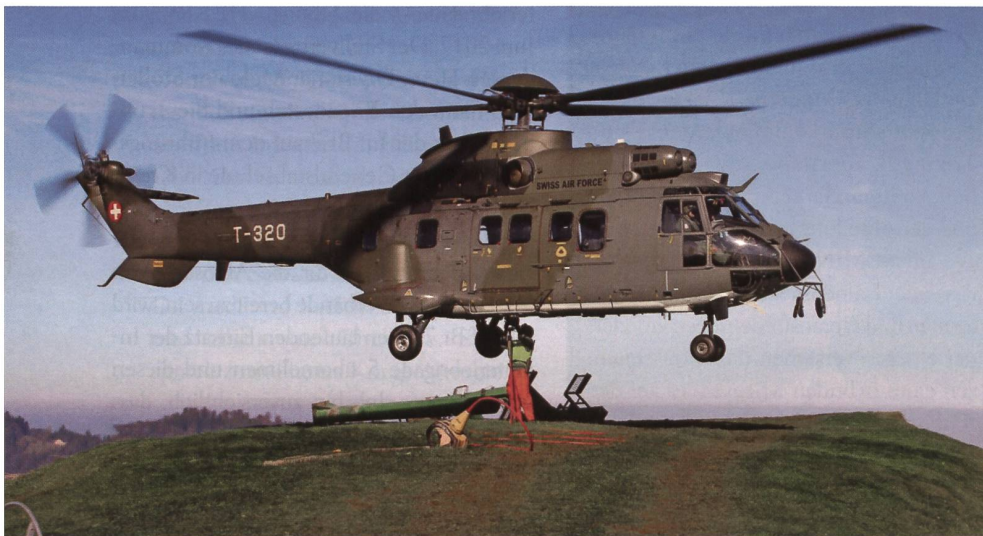
Präzisionsarbeit der Luftwaffe. Hinten ein Skiliftmast.