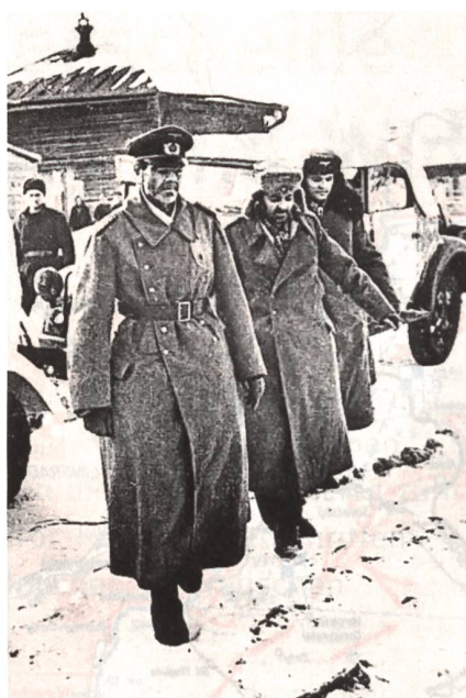
Der in letzter Minute, am 30. Januar 1943, zum Generalfeldmarschall beförderte Friedrich Paulus geht am 31. Januar 1943 in sowjetische Kriegsgefangenschaft.

Die von der NS-Propaganda verbreitete Gefahr des Bolschewismus sei unbe-