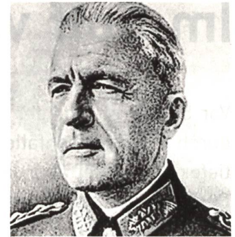
General Walter von Seydlitz.

boten. In seinem Buch «Verlorene Siege» bringt Manstein zum Ausdruck, Paulus habe die Chance des Ausbruchs trotz seines Winks nicht beachtet. Es steht Aussage gegen Aussage. Paulus scheint mir glaubwürdiger zu sein, da Feldmarschälle nicht zu «winken» pflegen.