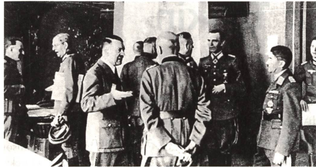
Der Führer Adolf Hitler mit Feldmarschall Friedrich Paulus.