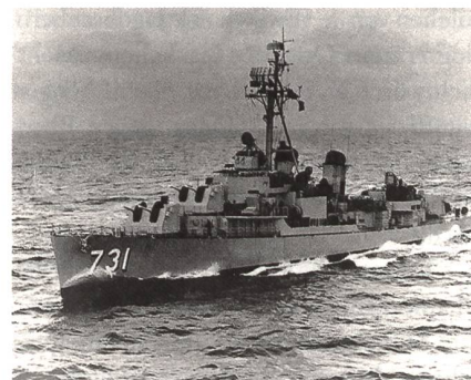
Die USS Maddox (DD 731) befand sich am 2. August 1964 vor der Küste von Nordvietnam, als sie angegriffen wurde.

F-8E-Crusader über dem Golf von Tonkin und in der Nähe der beiden Zerstörer geflogen. Um 18.30 Uhr kehrte er vom zweiten Einsatz zur Ticonderoga zurück.