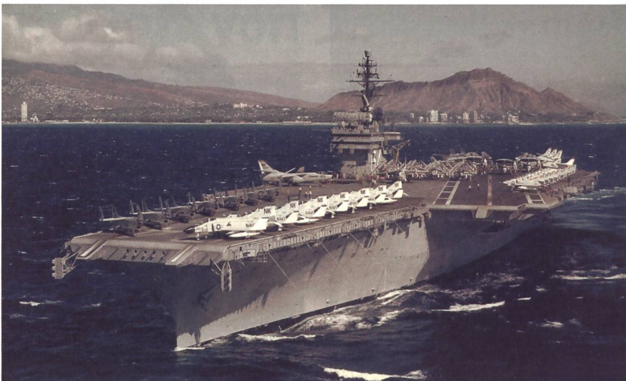
Im Mai 1964 verlässt die USS Constellation (CVA 64) Pearl Harbor, Hawaii, auf dem Weg in den Golf von Tonkin, an Bord das Marinefliegergeschwader 14. Am 5. August beteiligte sich der Träger an den ersten Luftangriffen auf Nordvietnam.

von den Zerstörern als weiterer möglicher Angriff von Torpedobooten interpretiert würden. Als Sofortmassnahme wurden zwei A-1H-Skyraider-Kampfbomber und zwei F-8E-Crusader unverzüglich zum Start befohlen, in einem sass wieder Freigattenskapitän Stockdale.