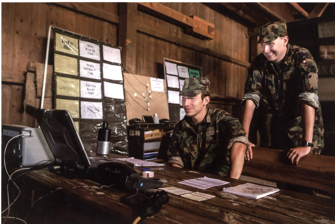
Einsatzstelle Telematik: Von hier aus werden die Netze geführt und überwacht.

Szenario: Ein Zugunglück im Raum Chiasso, nahe an der Grenze zu Italien. Chemiestoffe treten aus. Diverse militärische und zivile Einsatzkräfte üben die grenzüberschreitende Zusammenarbeit am abgelegenen Unfallort. Zwar verfügen alle Einsatzkräfte über ihr eigenes Kommunikationssystem - nur dank der FU Ber Kp 104 konnten diese aber auch untereinander kommunizieren und ihre Einsätze vor Ort koordinieren. +